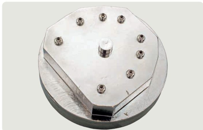
Тестовая модель № 0 является фрезерованной стальной моделью с ввинченными модельными имплантатами.