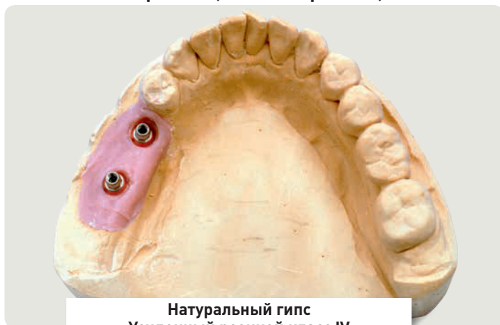
Натуральный гипс Усиленный резиной класс IV Оценка 1 SAE DENTAL VERTRIEBS GMBH

Победитель тестирования: Модель тест 1, Натуральный гипс усиленный резиной класс IV Оценка 1 (SAE-Специ-гипс)