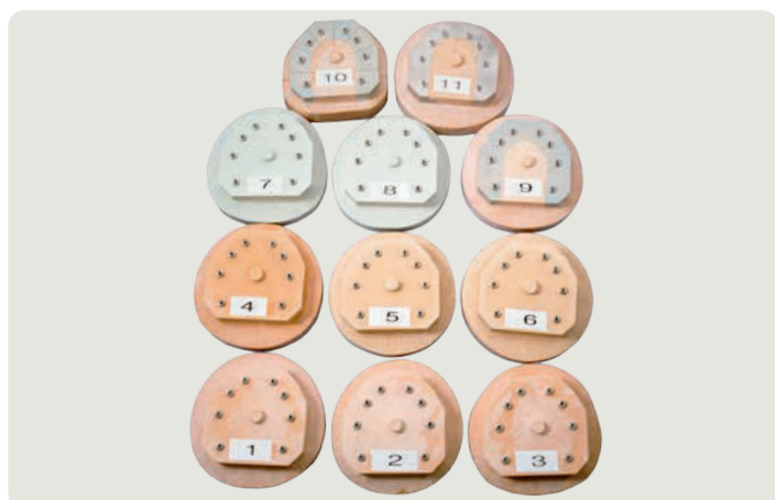
На 11-ти моделях измерялись реакции различных модельных материалов.