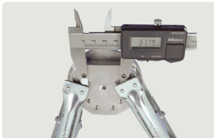
Измерения проводились с электронным измерительным инструментом.