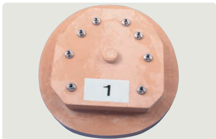
Оценка 1 для тестовой модели № 1 – из SAE-Специ-гипса.