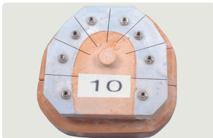
Оценка 1 для тестовой модели № 10 – из SAE-эпоксидной смолы и SAE-Специ-гипса.